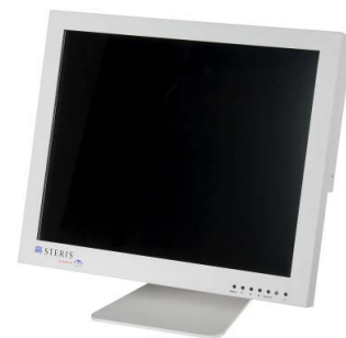
Moniteur tactile Optical Touch de 19 po.

Tenez compte des points suivants : Le Manuel d'utilisation de ce moniteur peut être téléchargé à partir du site www.vtsmedical.com . Cliquez sur PRODUCTS (PRODUITS) , puis sur DOCUMENTATION ; trouvez, dans la table, le numéro de pièce du moniteur, puis cliquez sur l'icône DOWNLOAD (TÉLÉCHARGER) .