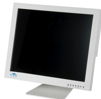
Moniteur tactile Optical Touch de 19 po.

Tenez compte des points suivants : Le Manuel d'utilisation de ce moniteur peut être téléchargé à partir du site www.vtsmedical.com . Cliquez sur PRODUCTS (PRODUITS) , puis sur DOCUMENTATION ; trouvez, dans la table, le numéro de pièce du moniteur, puis cliquez sur l'icône DOWNLOAD (TÉLÉCHARGER) .